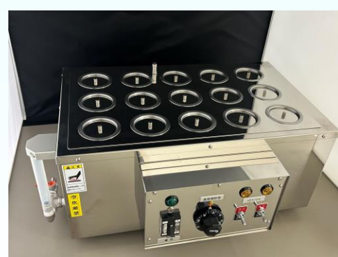
加温器の製作も承ります。