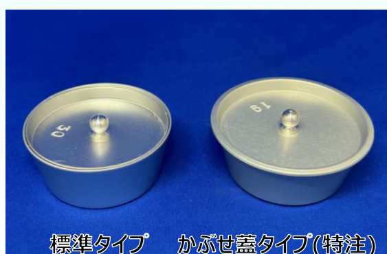
標準タイプ かぶせ蓋タイプ(特注)